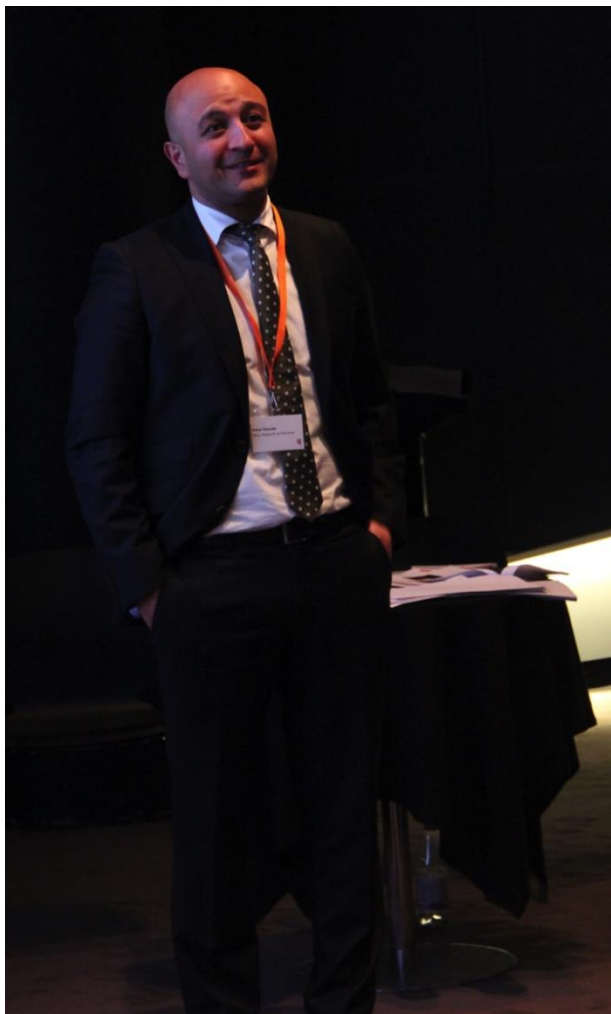
Efter præsentationen af de 11 trailere blev der lagt op til debat om problemstillinger og dilemmaer i forbindelse med det nye AB-system.