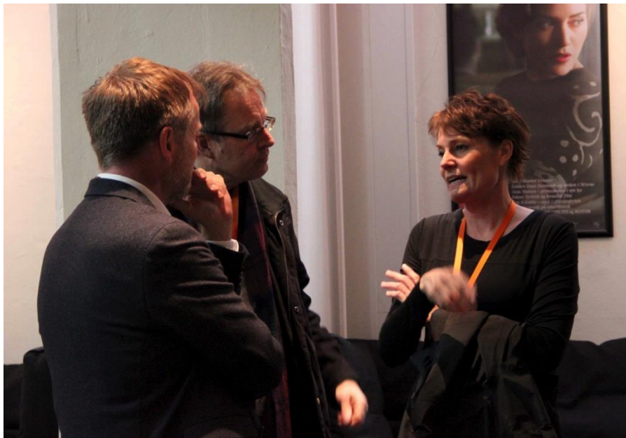
Cinematekets Bio Asta og den tilhørende Bar Asta satte stemningsfulde rammer for eftermiddagens arrangement.